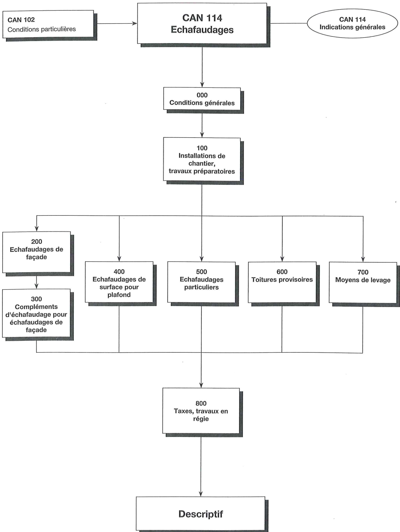
Schéma d'élaboration d'un descriptif